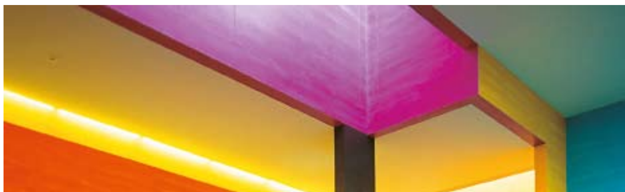
Les couleurs Sirius appliquée dans l'école Scherr, Zurich

la pureté ou du degré de saturation des couleurs. Ceci se révèle tout particulièrement dans les bruns et pastels fins. Le Sirius Primary System constitue à ce titre un assortiment complet de couleurs à partir de 5 couleurs primaires seulement.